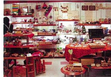
紙屋町地下街シャレオ内 常設販売店