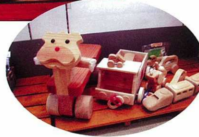
紙屋町地下街シャレオ