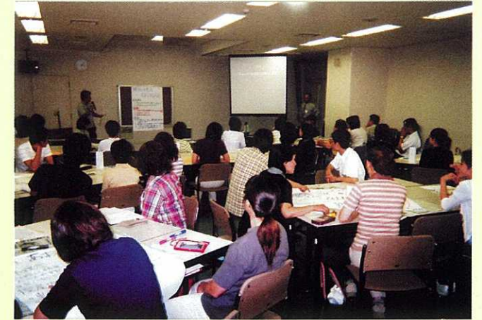
社団法人広島県就労振興センターでは、福祉事業及び就労等に関する研修を随時行なっています。