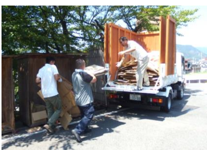
回収した段ボールを運ぶ