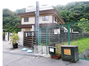
AMAに回収ボックスを設置

安芸の郷はリサイクル（再資源化する）、リユース（繰り返し使う）、リデュース（減らす）で環境配慮に努めています。