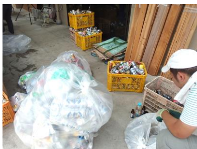
回収したアルミ缶を袋から取り出す → フレス機でつぶす