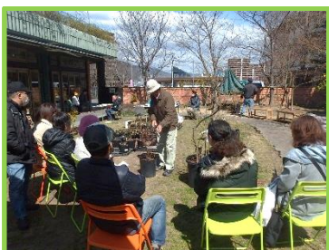
ブルーベリーの剪定の実演