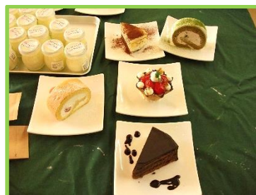
いろいろなスイーツ