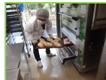
フェアの最中のパン工房