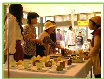
食堂のスイーツ販売