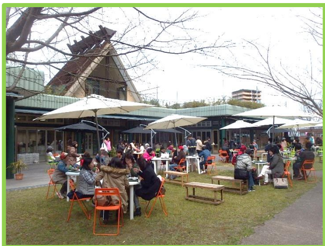
広い庭でランチやケーキ、焼き立てパンなども楽しむ